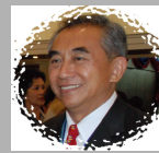
อภ.ประเสริฐ พักทองผล ที่ปรึกษา และ อดีตนายกทุกท่าน